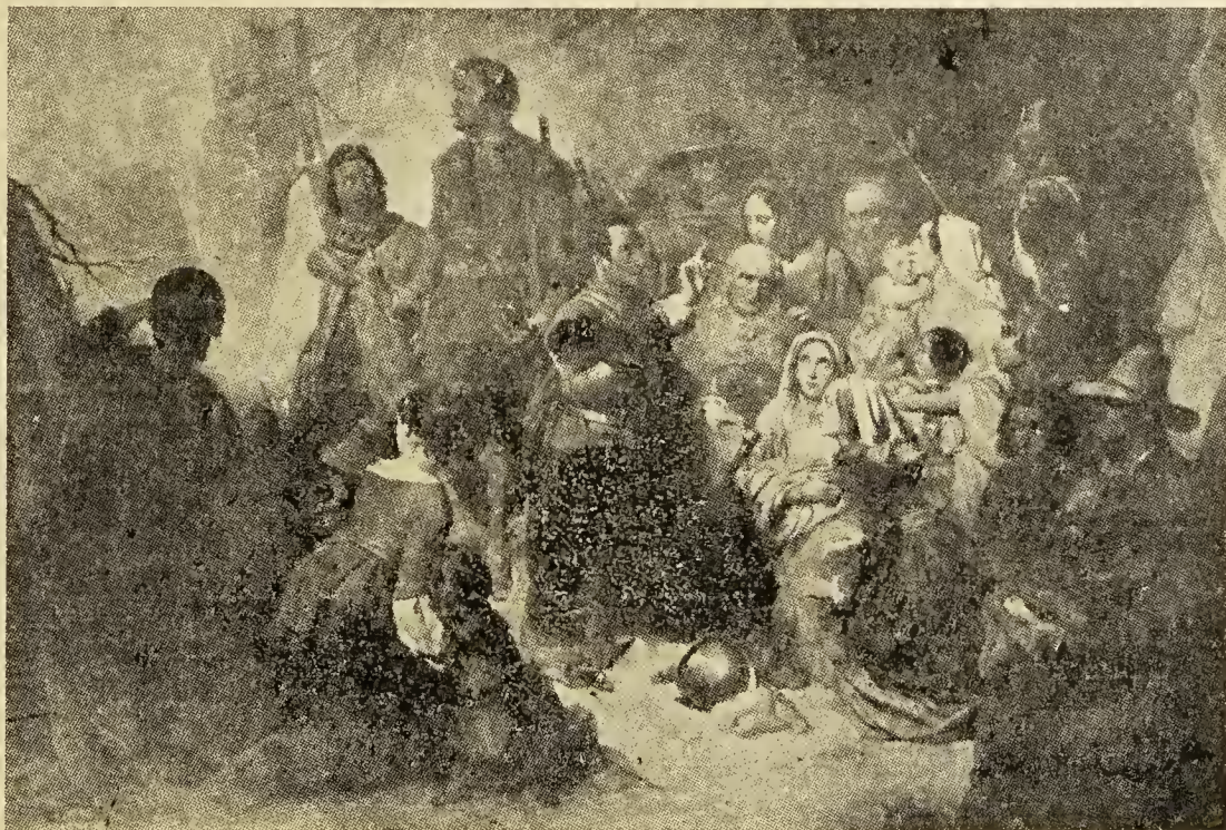
"Tened buen ánimo" (Juan 16-33). "Sed fuertes, no temáis" (Is. 35-4)

En fin, cada acción que ha de llegar a ser algo permanente en su vida la adquiere por repetidos y enfáticos esfuerzos. ¿Es sorprendente entonces que Dios llegue a ser para ellos algo así como un ser vago y místico o que Jesús sea solamente "alguien de quien oímos hablar en la Escuela Dominical" y no un verdadero amigo personal y ayuda-